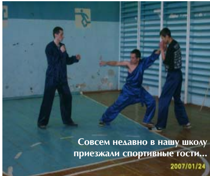
Совсем недавно в нашу школу приезжали спортивные гости...