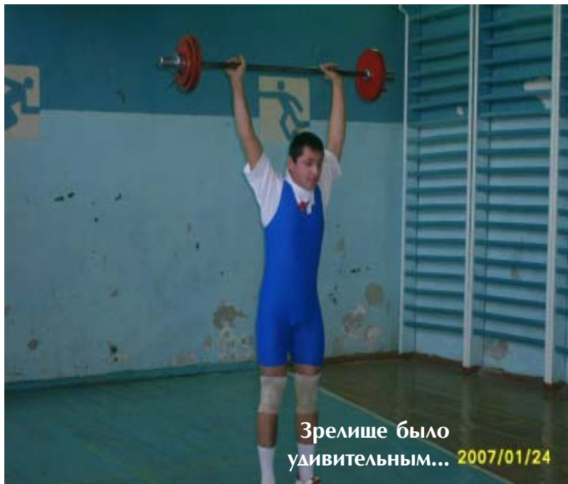
Зрелище было удивительным...