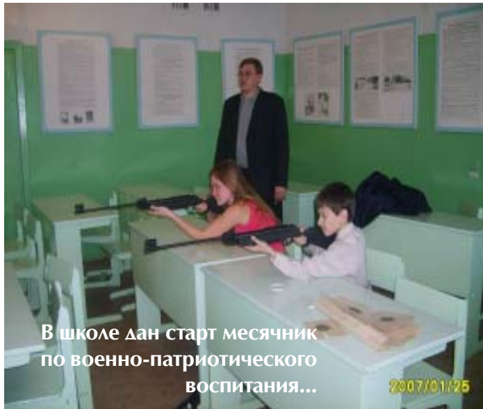
В школе дан старт месячник по военно-патриотического воспитания...

Новомалыклинской школы заняли 4 (!) место. И это здорово! Мы попали в 5-ку лучших! Физкульт УРА! УРА! УРА!