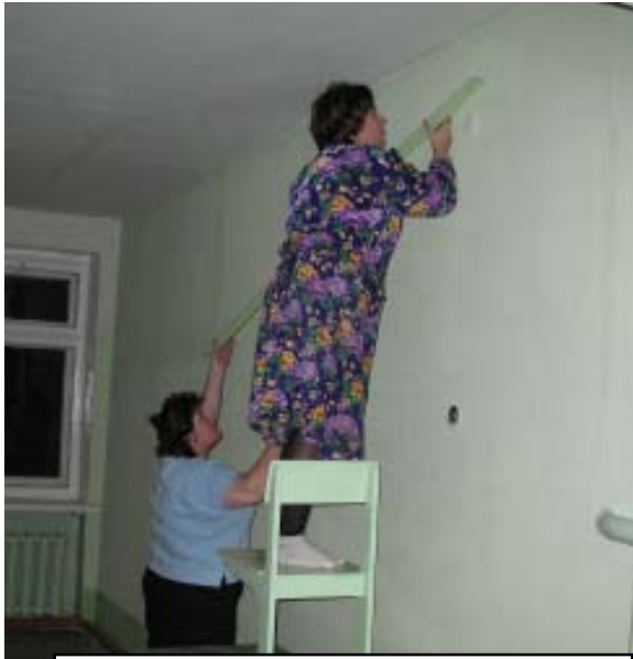
- Как Новый год встретишь...