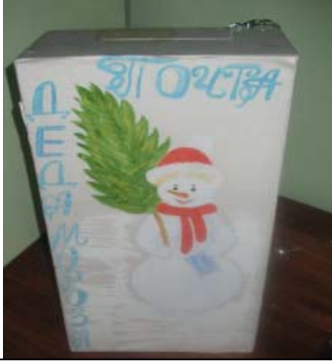
- Работает почта Деда Мороза. Пишите последнее в этом году письмо!

ДА... НОВЫЙ ГОД СОВСЕМ БЛИЗКО... СКОРО КАНИКУЛЫ, А ВПЕРЕДИ У НАС ЕЩЕ МНОГО-МНОГО ИНТЕРЕСНОГО, ВЕСЕЛОГО И УВЛЕКАТЕЛЬНОГО