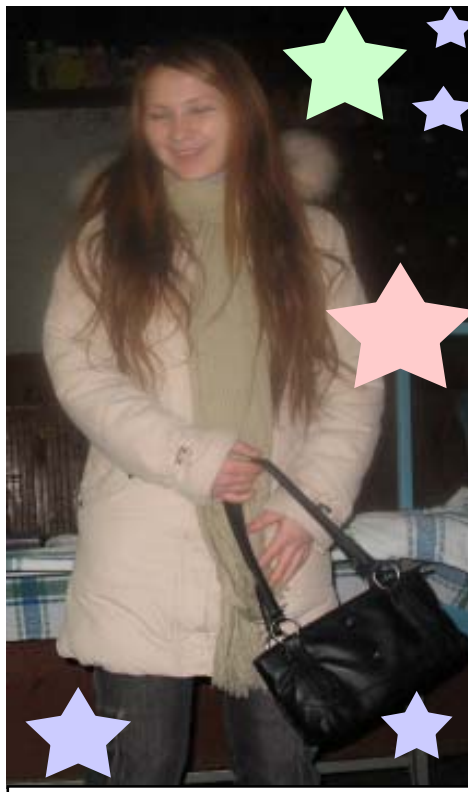
- Новый год самый веселый праздник...