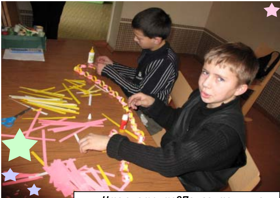
- Что смотрите? Помогите лучше...