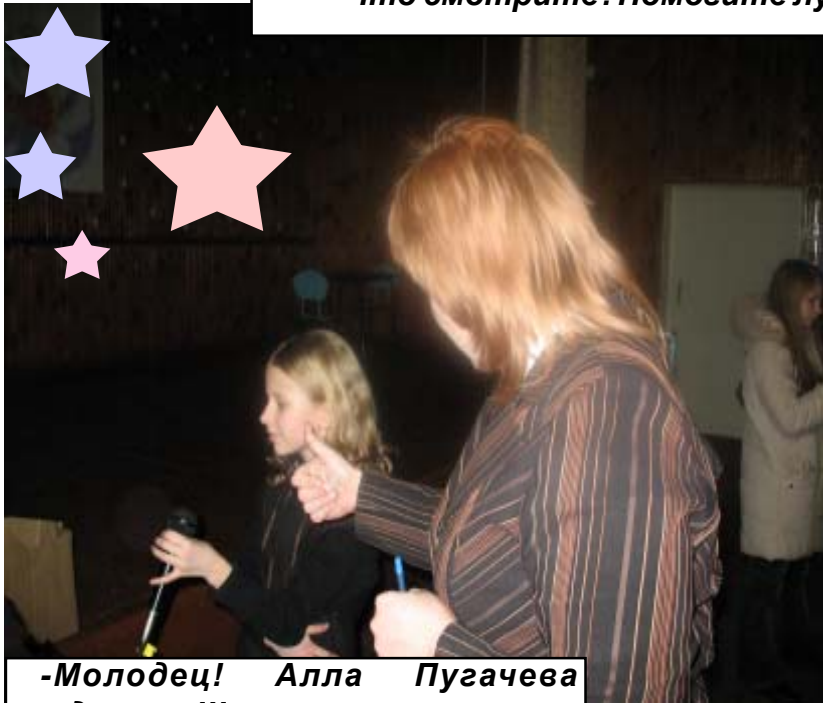
- Молодец! Алла Пугачева отдыхает!!!