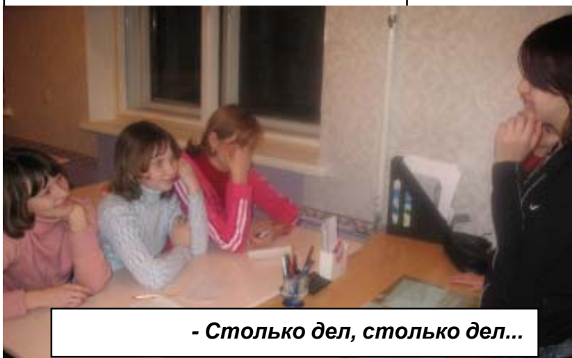
- Столько дел, столько дел...