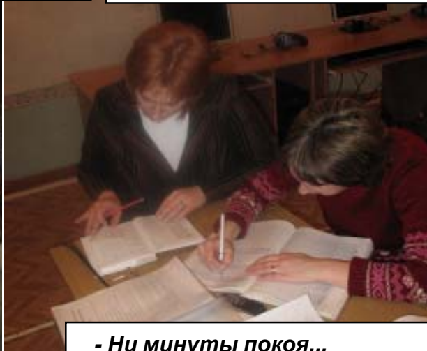
- Ни минуты покоя...